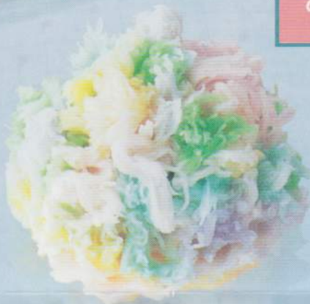
「春」ヴィヴァルディ