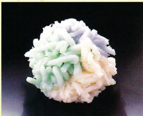
『ジムノペディ』サティ