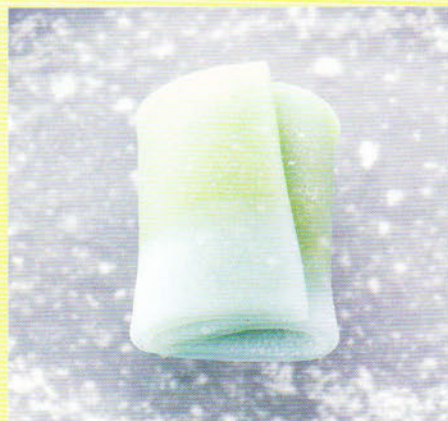
『ピアノ協奏曲第二楽章』グリーグ